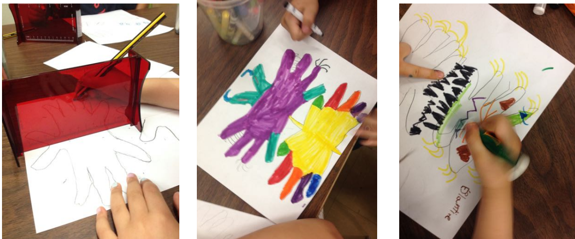
Œuvres réalisées par des élèves de 2 e et 3 e années

Réflexions s'inspire de l'exposition du même nom que l'artiste Chloé Desjardins présentait à Plein sud en juin 2015. Dans ses œuvres, et comme le titre l'indique, Desjardins fait appel au terme réflexion qui définit à la fois un mode de pensée, mais qui fait aussi appel à la notion de reflet, d'image renvoyée par le miroir. Dans cet atelier de création, les élèves utilisent la notion de symétrie ainsi que leurs mains afin d'inventer une créature imaginaire.