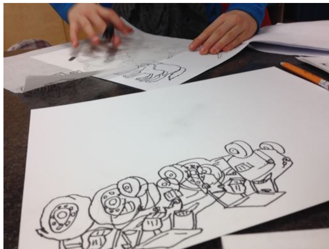
Œuvres produites par des élèves de 5 e et 6 e années