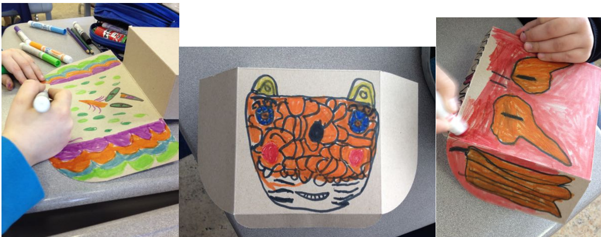
Réalisation d'élèves de maternelle et de 1 re année

Mon animal fantasmagorique s'inspire d'œuvres de l'artiste Maurice Savoie , un sculpteur et céramiste longueuillois dont les bêtes imaginaires étaient créées en mélangeant plusieurs textures, motifs et parties d'animaux dans la même œuvre. Nous réalisons une boîte à secrets qui s'inspire de cette démarche artistique extrêmement ludique.