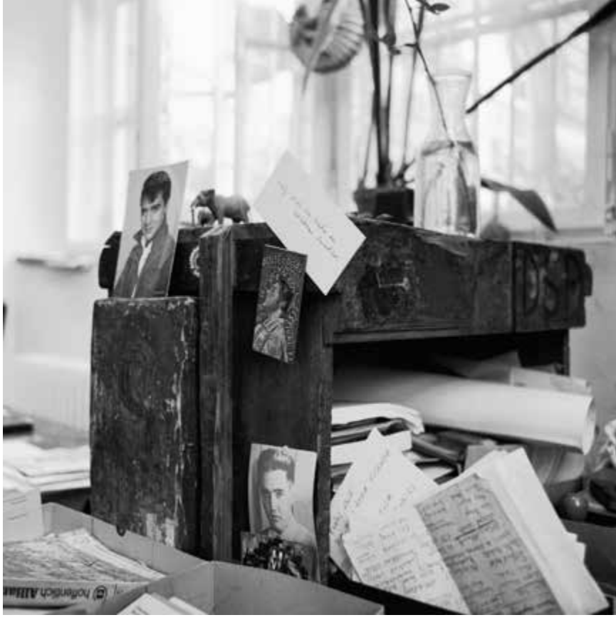
Lettres, cartes et documents divers sur le bureau principal, 1984, impression au jet d'encre, 50,8 x 50,8 cm