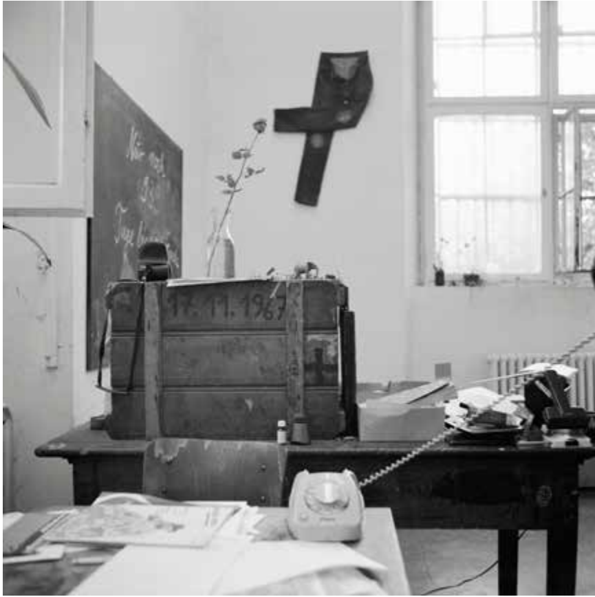
Table avec téléphone, 1984, impression au jet d'encre, 50,8 x 50,8 cm