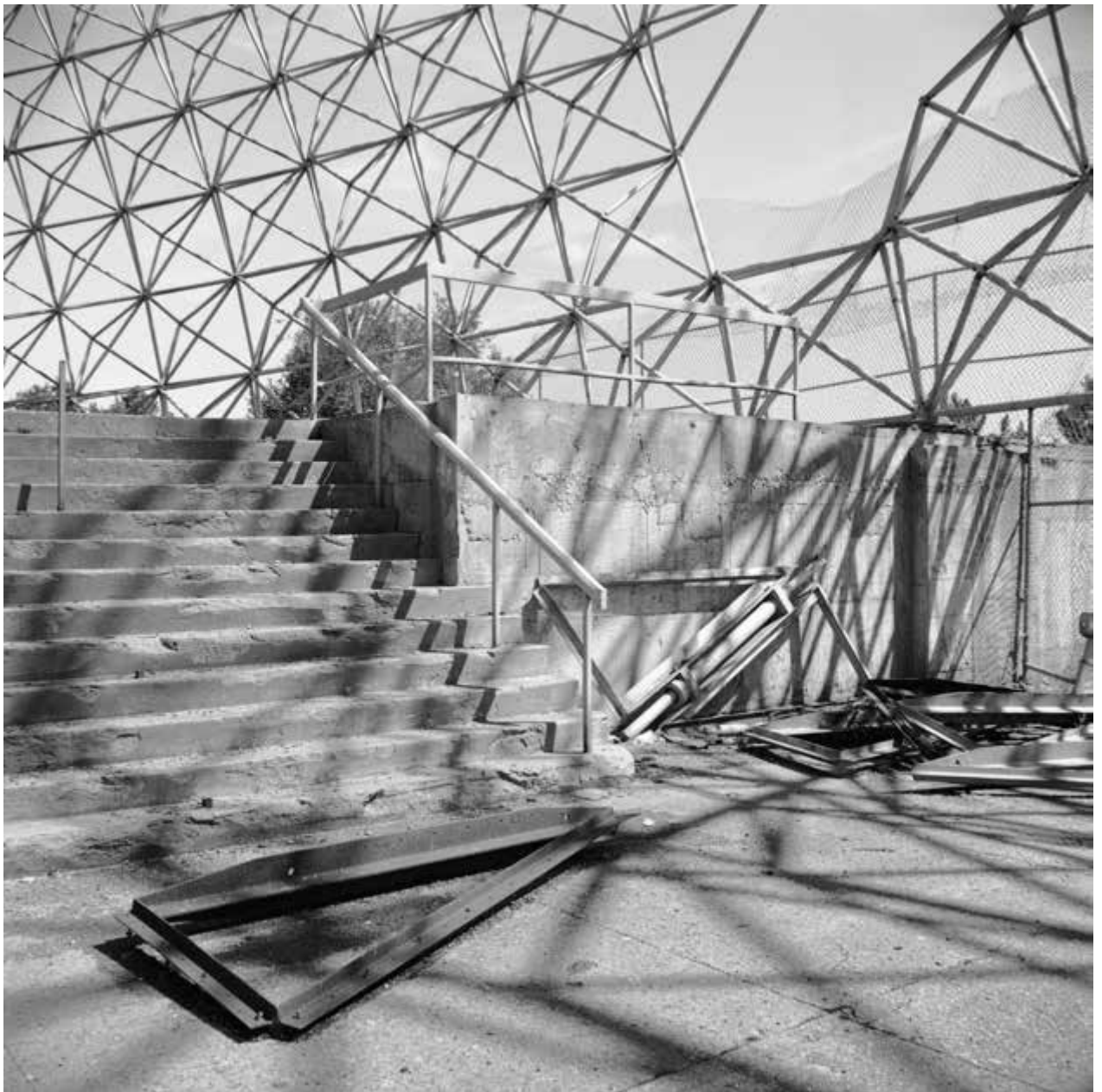
Cadre de portes de la sortie principale , 1984, impression au jet d'encre, 50,8 x 50,8 cm