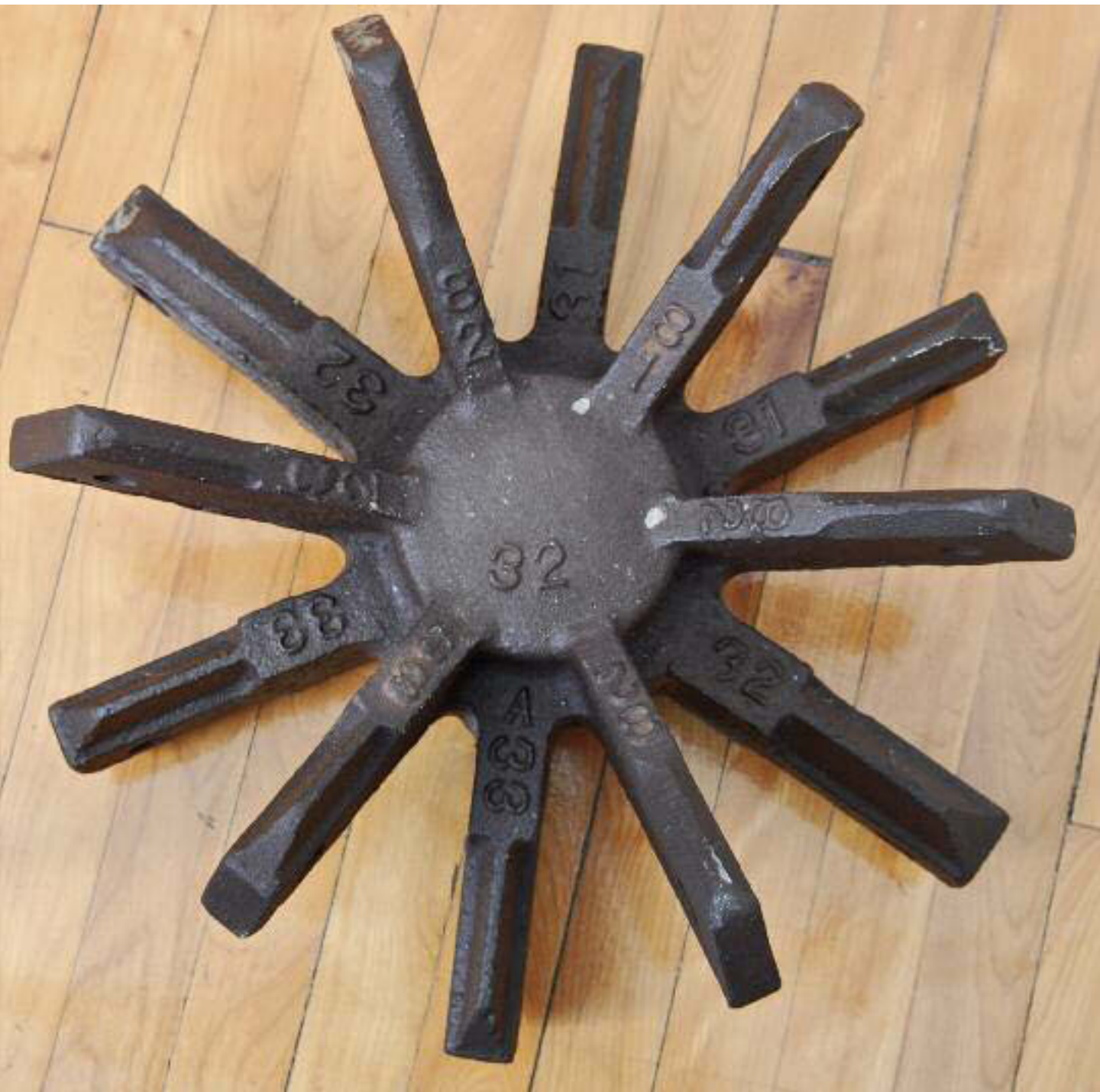
Composante de la membrane extérieure, 1984, moyeu central en acier, 26 cm de hauteur et 45 cm de diamètre