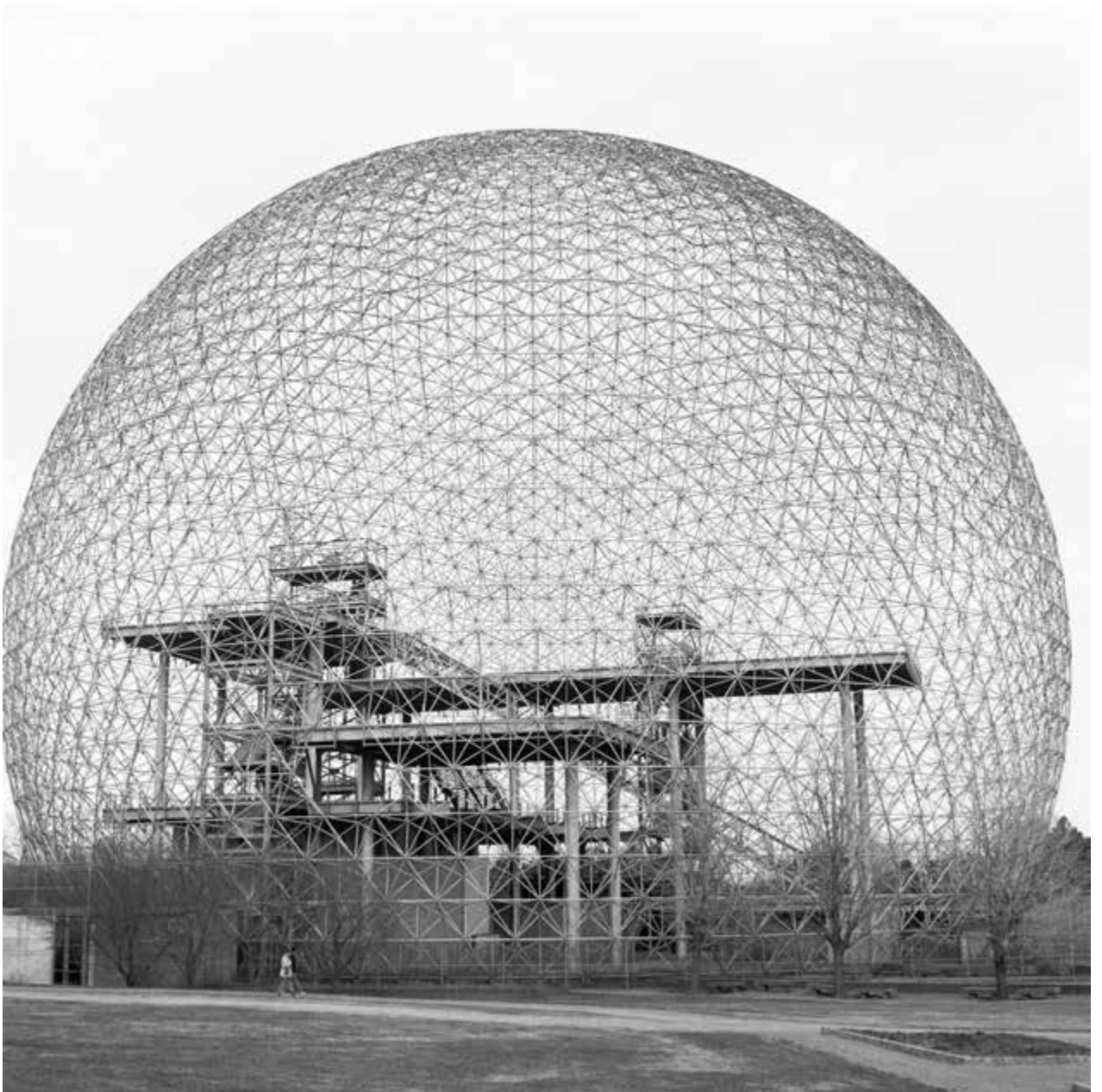
Vue extérieure de la Biosphère Fuller, 1984, impression au jet d'encre, 50,8 x 50,8 cm