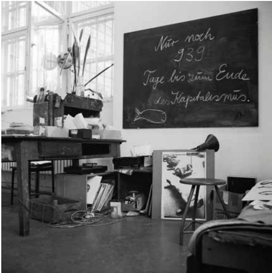
Tableau avec une déclaration sur la fin du capitalisme, 1984, impression au jet d'encre, 50,8 x 50,8 cm