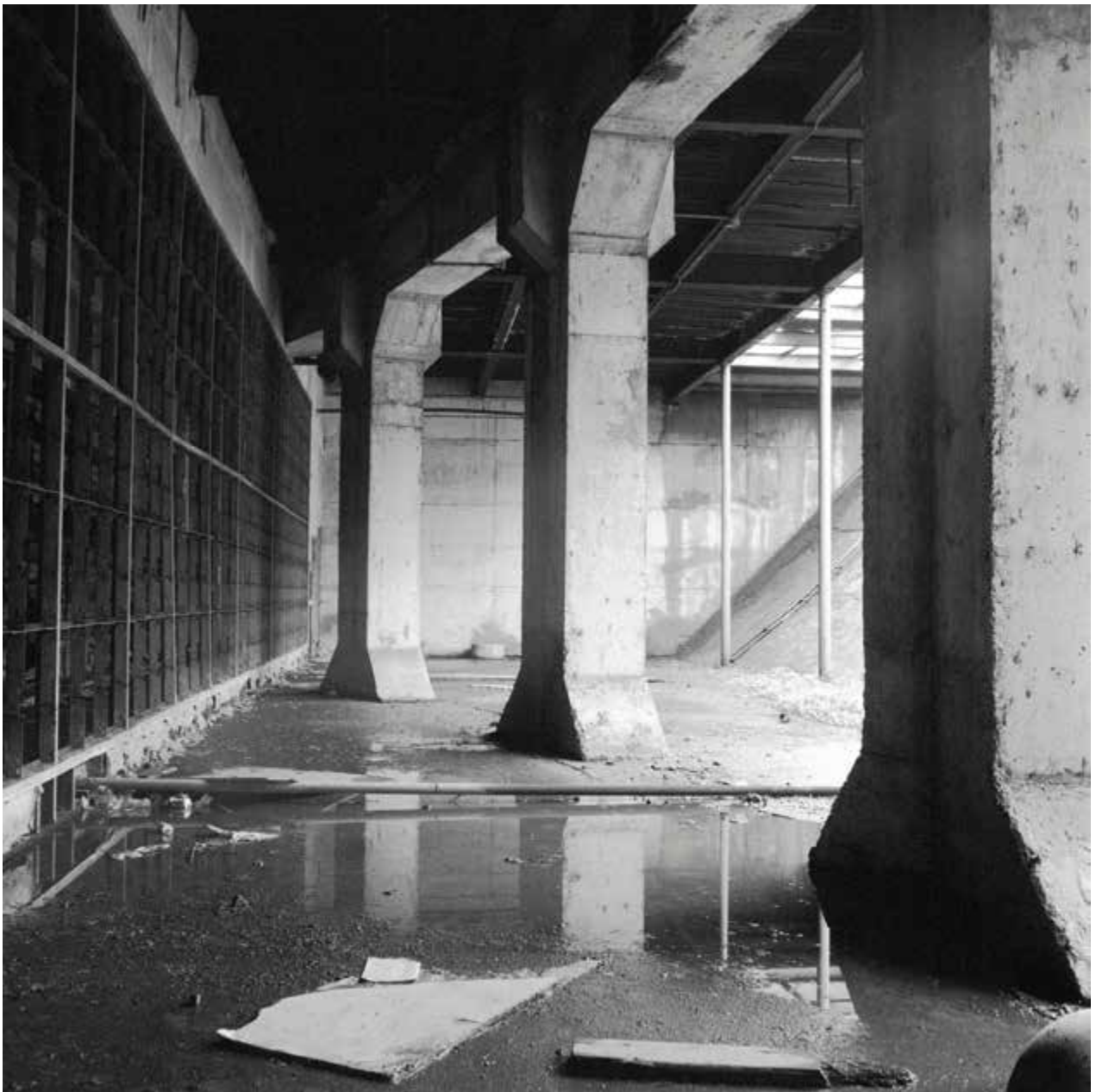
Chambre de ventilation zone Est, 1984, impression au jet d'encre, 50,8 x 50,8 cm