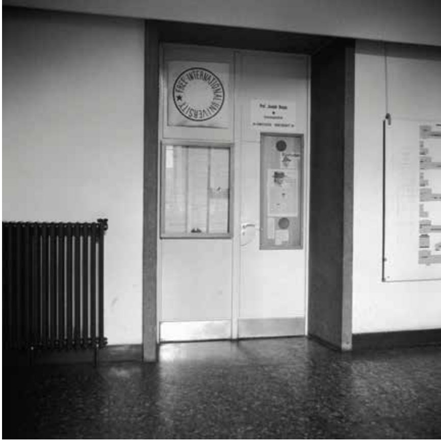
Porte d'entrée du studio, 1984, impression au jet d'encre, 50,8 x 50,8 cm