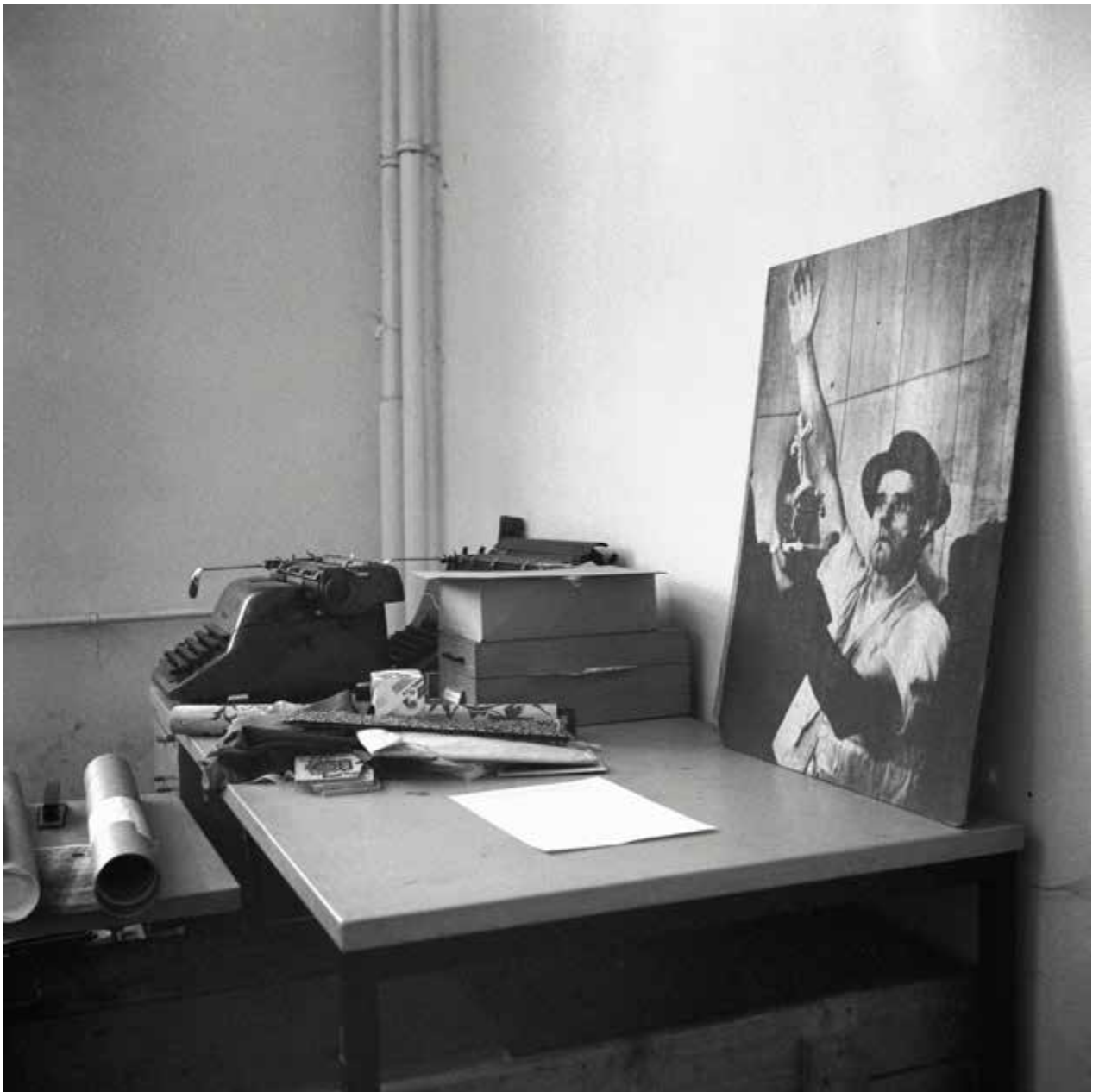
Table de travail avec machine à écrire et grande photographie de la performance Fluxus de 1964, 1984, impression au jet d'encre, 50,8 x 50,8 cm