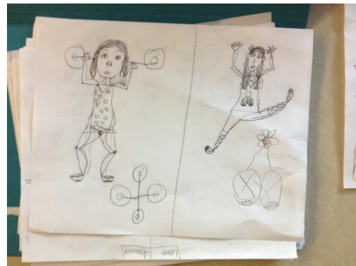
Dessins réalisés par des élèves de 5 e et 6 e années

Cette animation est très populaire auprès des élèves de la 3 e à la 6 e année. Au cours des deux heures en classe, les élèves sont introduits à des techniques de dessin de personnages : visages, expressions, émotions, proportions humaines et positions du corps. Cet atelier est ponctué d'exercices pratiques au cours desquels les élèves mettent en œuvre les notions apprises dans le courant de la rencontre. Le but de cet atelier est de permettre aux participants de dessiner, dans leurs œuvres personnelles, des personnages réalistes et proportionnels qu'ils pourront ensuite enrichir d'émotions diverses.