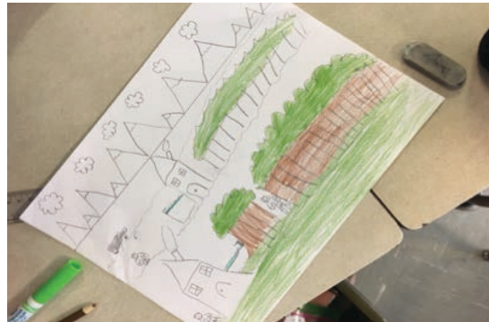
Œuvre créée par des élèves de 1 e et 2 e années

Ce thème offre des notions historiques et théoriques qui permettront aux élèves de se familiariser avec le paysage, l'utilité de ce dernier dans l'histoire de l'art et les diverses façons de le représenter depuis le 15 e siècle. Les élèves apprendront quelques techniques de dessin ainsi que les rudiments de la composition de l'image et de l'utilisation de la perspective qui leur permettront, par la suite, de réaliser des paysages à la hauteur de leurs attentes et en appliquant des connaissances nouvellement acquises.